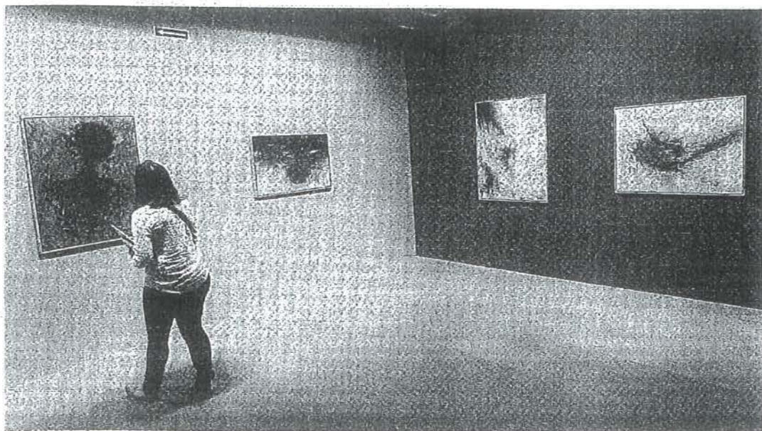
Cuatro de las obras recopiladas para esta exposición inédita en el Museo Gustavo de Maeztu de Estella-Lizarrá.