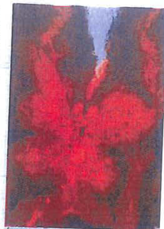
Óleo de su visión desgarrada de la vida.