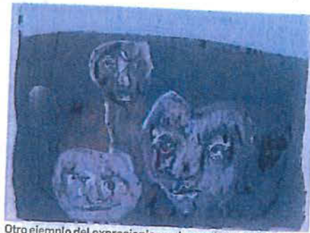
Otro ejemplo del expresionismo de sus últimos años. MTX