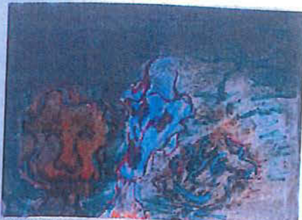
Dibujo expresionista con toques figurativos.

El museo de Estella ha montado la que es la primera exposición de este artista francés en España como muestra estrella de su 25 aniversario. La calidad de su obra, a través de 18 pinturas de colecciones privadas, puede apreciarse hasta septiembre