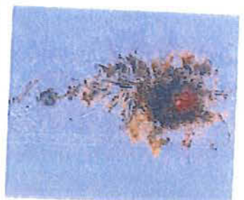
Obra de su etapa de abstracción lírica. MTX