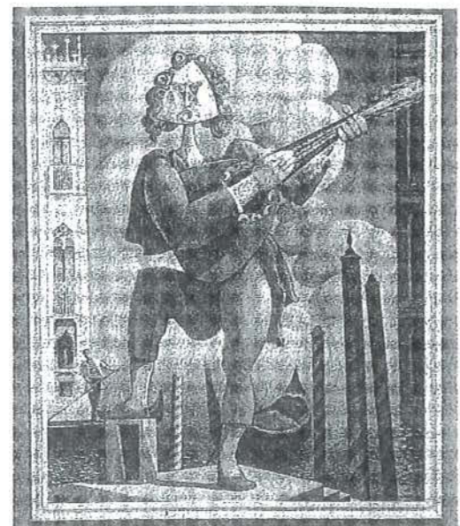
Una de las obras de Isidro López Murias, afincado en Navarra. MONTDAG

autora de un catálogo disponible en la exposición. De la luminosidad casi impresionista de Carmen Selves, a la esquematización geométrica de Vento González, las escalas este viaja por el mundo de la figuración se detienen en el realismo onírico de Murias o el fotográfico de Tere Duro, con otras paradas, como la investigación volumétrica de Carmen Guardia sobre mujeres mitológicas. También se incluye el trabajo