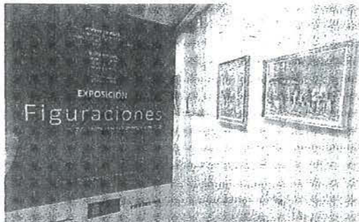
La última exposición permanecerá en el museo estellés hasta el próximo 9 de octubre. MONTDAG

La revisión de estilos es un ejercicio obligado en el mundo del arte. Esta vez es el Museo Gustavo de Maeztu el que desempolva el estilo originario de la pintura, la figuración, que hasta buena parte del siglo pasado quedó silenciada por la irrupción de las vanguardias. Tras unas décadas de eclosión de nuevos estilos artísticos, el trabajo de muchos pintores volvió a las raíces, a la representación real de la figura humana y los objetos, aunque, eso sí, desde una perspectiva subjetiva que generó una renovación del concepto. En su última exposición, que finaliza el próximo 9 de octubre, el museo