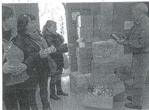
Imagen del año pasado cuando también se recogió ayuda. HONTOMO AG.

La ayuda humanitaria -la quinta que se remite desde Viana a Sierra Leona- se cargó en un camión cedido por la empresa Pacharán La Navarra. A bordo del vehículo