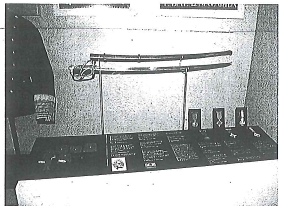
Fondos del Museo del Carlismo, inaugurado el 23 de marzo.