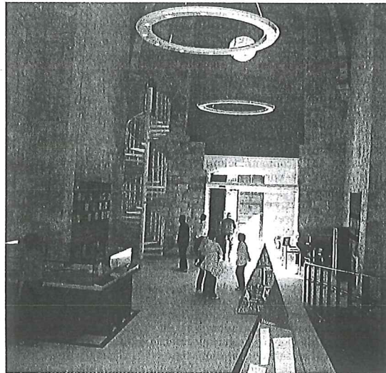
Santa María Jus del Castillo es un museo del Románico.

Merkatondoa acoge las 12.000 piezas del museo etnológico hasta que éste se habilite