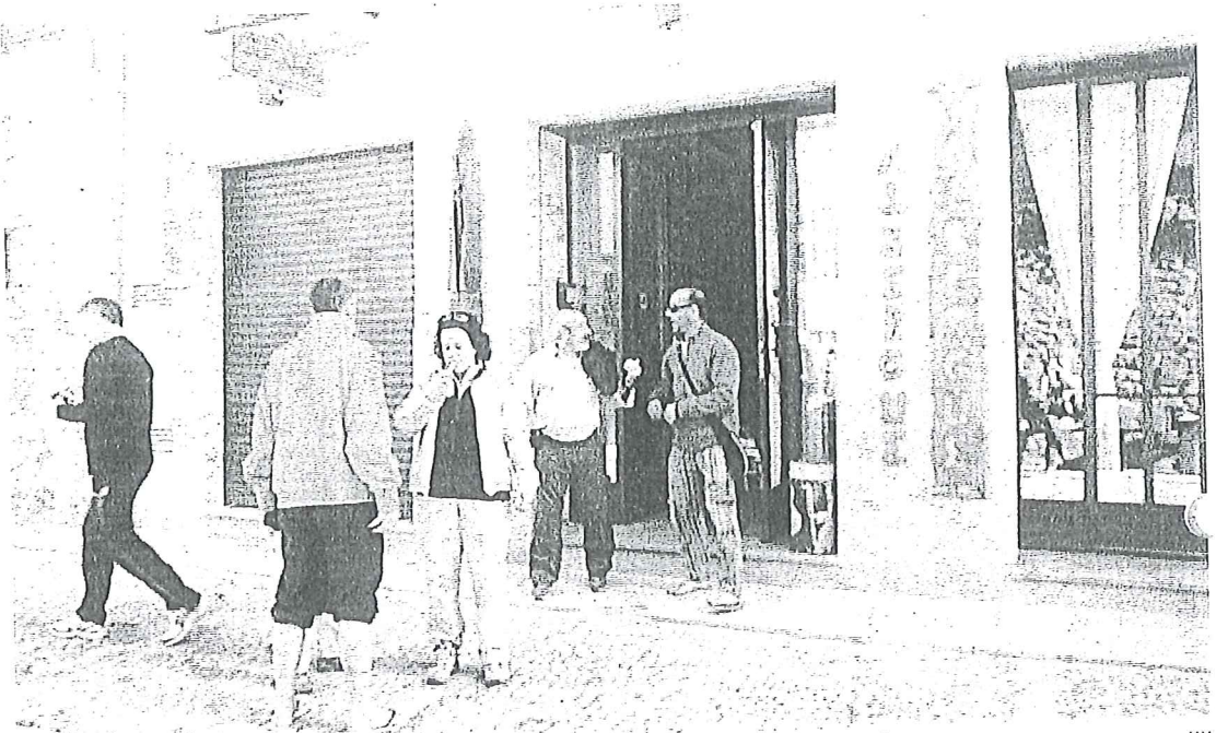
Ayer, el mayor número de visitantes se concentraba en torno al albergue de peregrinos municipal de Estella.

Esto ha traído otra consecuencia para Estella: un flujo continuo de personas en esta parte del barrio monumental, en el que también además de la oficina y el mu-