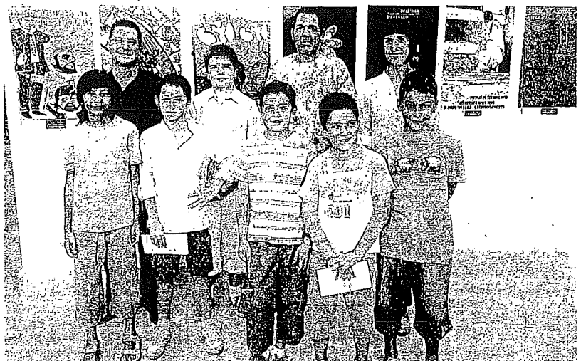
Ganadores y autoridades locales posan en una foto de familia durante la inauguración de la muestra.

Documentación local Unas fechas que, afirmó, ha conocido en años pasados. "Y también las he visitado cuando he ganado el cartel". Pero su diseño no se inspira en estos días de juerga. "Suelo documentarme mucho acerca de las costumbres locales", afirmó. Y,