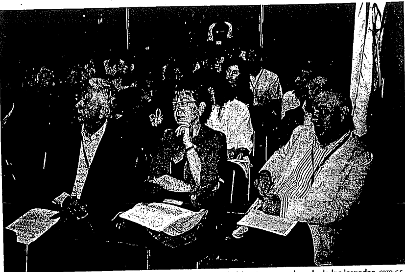
Los asistentes llenaron el salón de actos del Museo Gustavo de Maeztu, que es la sede de las jornadas.