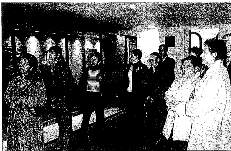
Los participantes en la visita durante los primeros minutos del recorrido, en la zona que conserva dibujos de Maeztu.

La tierra ibérica , pintada en 1916, es una alegoría sobre España en la que el pintor plasmó una visión del país e intentó reflejar sus elementos universales, además de que se representa un nuevo pueblo de gran fortaleza física y espiritual que intenta levantar la nación. La obra de Gustavo de