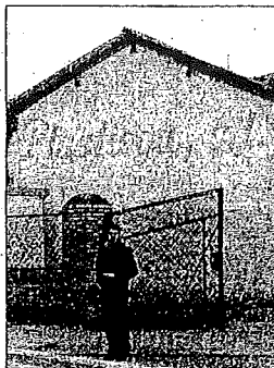
Antigua fábrica de Plastiega

concreto, está previsto que ese solar acoja bloques con 64 viviendas y 4 unifamiliares que cerrarán el frente con la calle Zumalacárregui. Además también habrá un garaje subterráneo con 120 plazas de las que 30 serán cedidas al consistorio.