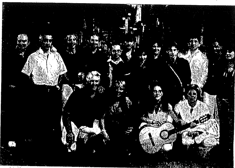
Todos los colaboradores del proyecto musical se reunieron en Azagra durante la actuación del grupo.