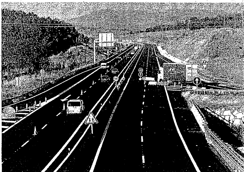
Imagen tomada ayer en el tramo que une el enlace de Villatuerta con el de Estella.

ESTELLA. Mañana, miércoles, se abren al tráfico sobre las 11.00 horas 4,5 kilómetros más de la Autovía del Camino, con lo que Estella y Pamplona estarán comunicadas ya totalmente por una vía de gran capacidad. En los últimos días se están dando los últimos retoques al tramo de variante desdoblado que une el enlace de Villatuerta y el de la ciudad del Ega, a la altura de la rotonda de la carretera de San Adrián. El resto del desdoblamiento no estará terminado hasta "junio o julio", según el consejero de Obras Públicas del Gobierno de Navarra, Álvaro Miranda, quien señaló recientemente que la apertura coincidirá con la del tramo de la A-12 que llega hasta Los Arcos y que se encuentra ya bastante avanzado. >R.U.