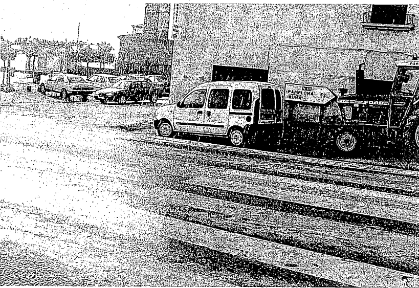
Imagen de la travesía de Urbiola durante la granizada que cayó ayer a las 16.30 horas.

Además, la visibilidad en ese tramo se redujo repentinamente cuando el radiante sol dejó paso a unas negras nubes que tronaron con la tanta fuerza como si de una tormenta de verano se tratara. >C.S.