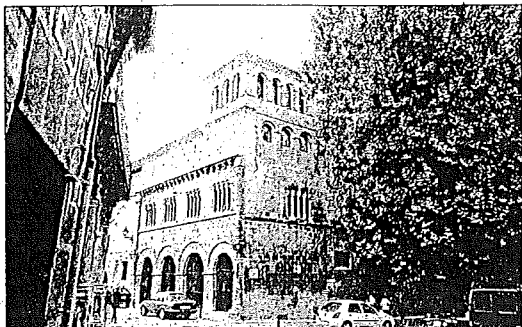
MUSEO Uno de los edificios que se iluminarán