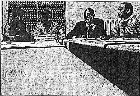
EXPLICACIÓN Los ediles socialistas explican su postura sobre el borrador. M. TRÉBOL

Adoptará hoy esta postura por "responsabilidad" y critica la gestión