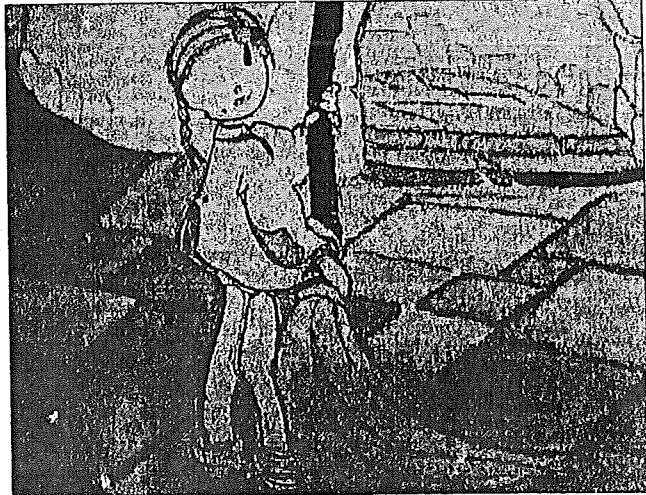
MUESTRA Esta obra es una de las que forma parte de la exposición itinerante.