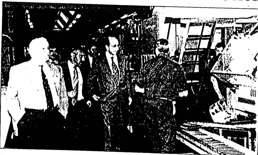
El presidente del Gobierno de Navarra recorrió las instalaciones acompañado por el consejero de Industria y por el director general de GESA.