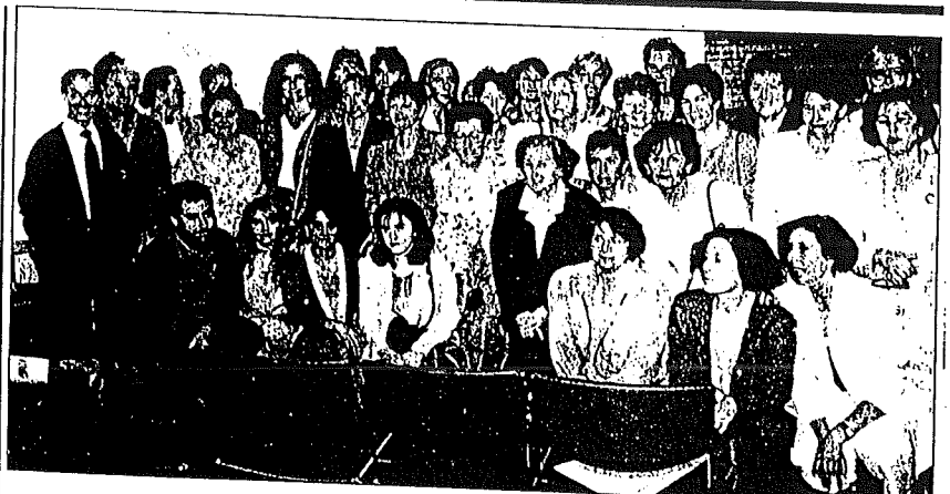
Las alumnas, tras la entrega de los diplomas.

Departamento de Agricultura, Ganadería y Montes