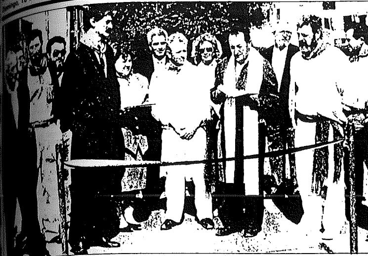
Momento del acto inaugural.