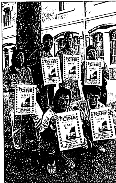
JÓVENES Miembros de Cinéfilos Anónimos.

La iniciativa comenzó en noviembre de 1992, para paliar la carencia de una sala comercial de cine. La afluencia de espectadores ha ido en aumento, al pasar de una media de 125 en 1993 a 170 de enero a mayo de este año, con un total de 2.385 espectadores. El presupuesto de 1994 ronda los dos millones, con un déficit previsto de 785.700 pesetas, que será costado por el Ayuntamiento y el Gobierno, a partes iguales.