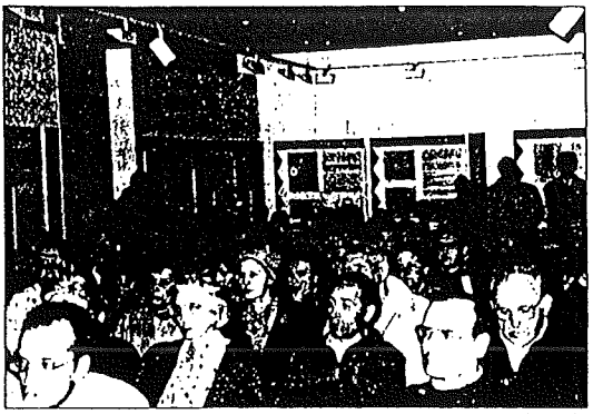
La sala del museo se llenó por completo de estelenses.