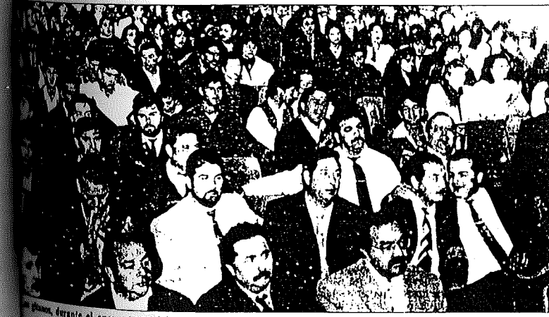
Los gitanos, durante el encuentro celebrado en Lodosa.

La conferencia recogió diversos momentos de esta primera contienda, hasta llegar al asalto de Bilbao «la trágica decisión que supuso la muerte de Zumalacárregui, la pérdida de su principal caudillo y, sobre todo, el comienzo de las intrigas entre los propios generales carlistas, lo que llevará al descrédito de la causa». A pesar de este suceso, Urquijo resaltó que queda un ejército carlista consolidado, al mismo tiempo que se asiste a una generalización del conflicto.