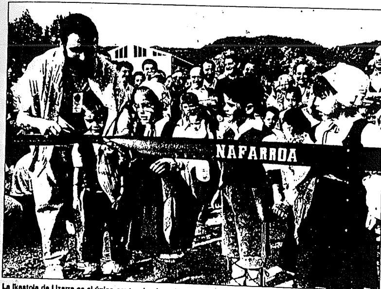
La ikastola de Lizarra es el único centro donde se imparte el modelo D.

La campaña de este año es la cuarta que se realiza en nuestra localidad y consiste fundamentalmente en el envío de una carta, firmada por el alcalde y dirigida a los padres con hijos/as de 3 años, en la que se exponen los beneficios del bilingüismo para el desarrollo intelectual del niño. En Lizarra se imparten tres de los cuatro modelos lingüísticos posibles en Euskal Herria. El modelo mayoritario es el G (totalmente en castellano); en menor medida existe además el modelo A (todas las horas en castellano menos las horas de asignaturas de euskara) y el modelo D