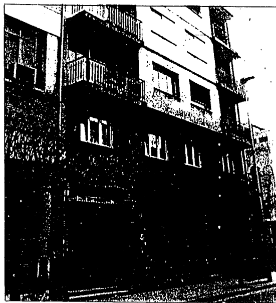
Edificio de correos, en el Paseo de la Inmaculada.