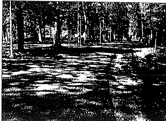
Paseo de Los Llanos.

La CUE ha elaborado una propuesta de trabajo, que pretende