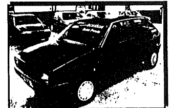
SEAT IBIZA 1.2 Año 87 desde 7.829 ptas/mes