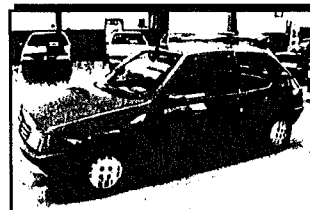
PEUGEOT 205 XL. Año 89 desde 13.392 ptas/mes