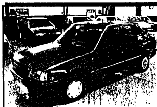
PEUGEOT 309 Diesel. Año 89 desde 17.049 ptas/mes