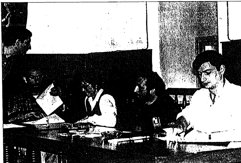
HBko zinegotziek berdintasunaren aldetik gertatzen diren kontraesanak salatuz.

Hurrengo puntuan Oinarriak taldeak bidalitako akordio proposamena aztertu zuen batzarrean, aho batez bost puntutako akordioa onartzen zelarik.