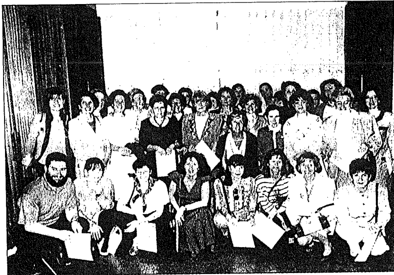
Las cuarenta cursillistas posaron junto con el profesor del curso.