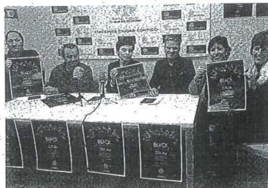
Miembros de la asociación presentaron la campaña.