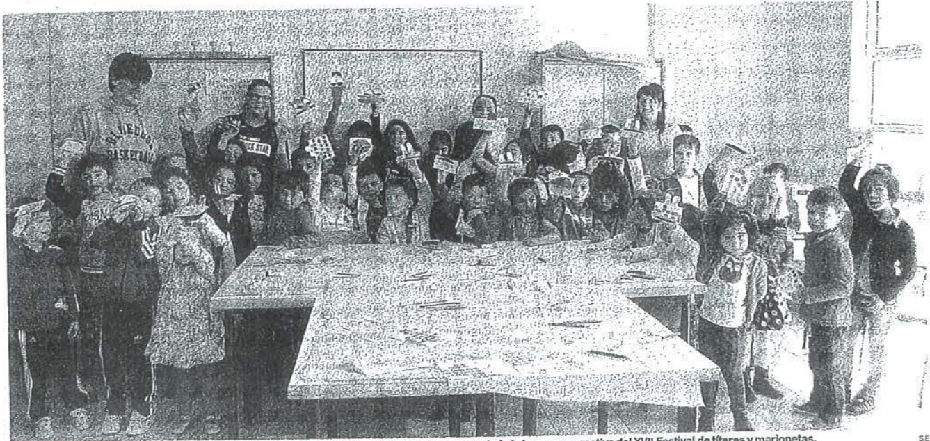
Casi medio centenar de niños han participado en el taller de confección de San Adrián que terminó el viernes, con motivo del XVII Festival de títeres y marionetas.

Conciliar vida laboral y familiar cuando hay parón en las aulas no siempre resulta tarea fácil. Ayuntamientos e instituciones amplían sus programas para hacerlo más llevadero y abren a los pequeños nuevas actividades de la cultura a la naturaleza.