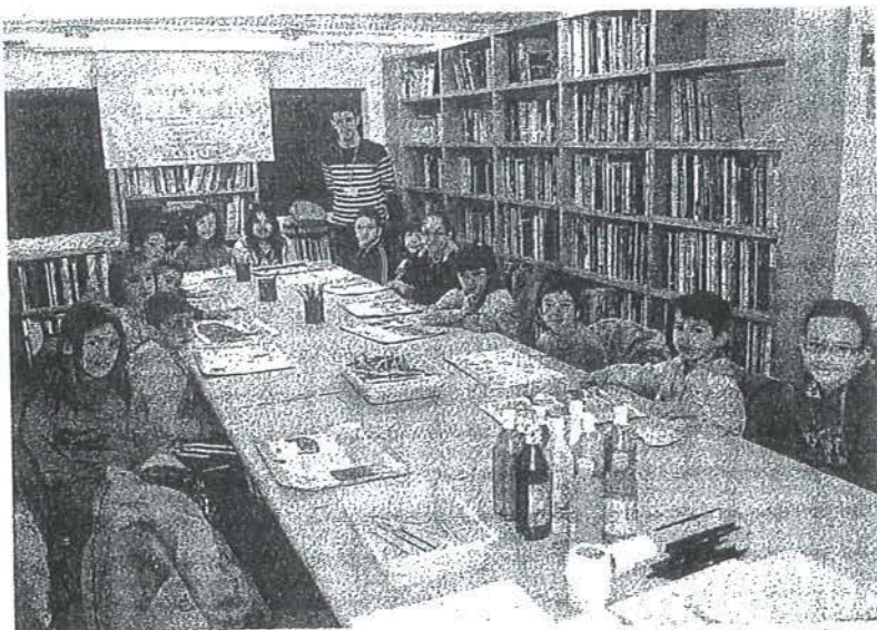
En la biblioteca del Gustavo de Maeztu los pequeños han trabajado con obras del autor y algunos poetas.