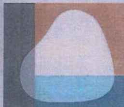
Otro de los 'Sin título'. DN