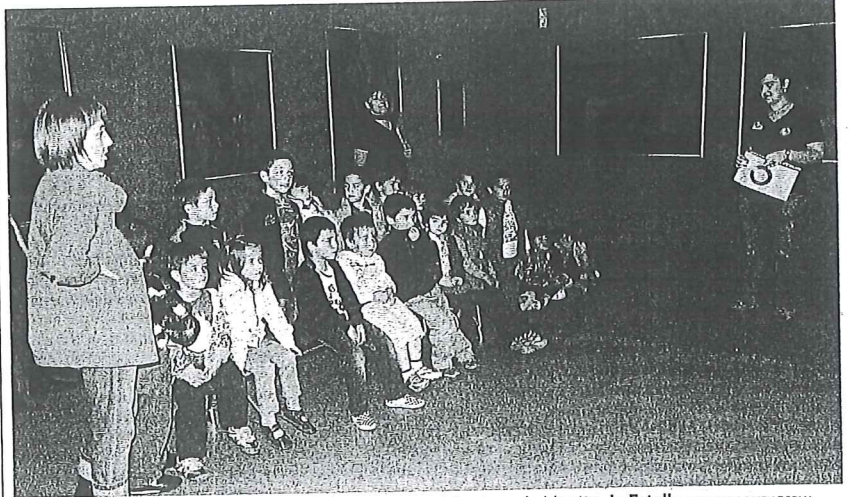
Una de las visitas escolares que se celebraron ayer en el Gustavo de Maeztu de Estella.

Estos galardones toman su nombre del insigne dramaturgo español Antonio Buero Vallejo. Hasta el momento, más de 25.000 jóvenes han participado en las seis ediciones anteriores de este certamen que es todo un referente para las nuevas promesas del teatro español. >DIARIO DE NOTICIAS