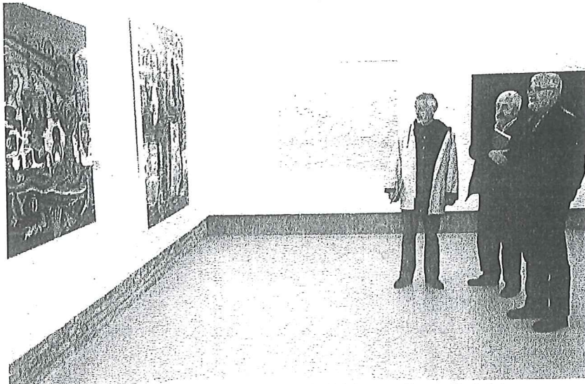
Muchos fueron los visitantes que se acercaron, el mismo día de la inauguración, a ver los trabajos.

● Blog. En la página oficial del museo, www.museogustavodemaeztu.com , están trabajando en crear un blog con el nombre En defensa de la pintura que sirva de medio de comunicación entre artistas consagrados y amateurs para hablar sobre temas relacionados con la pintura.