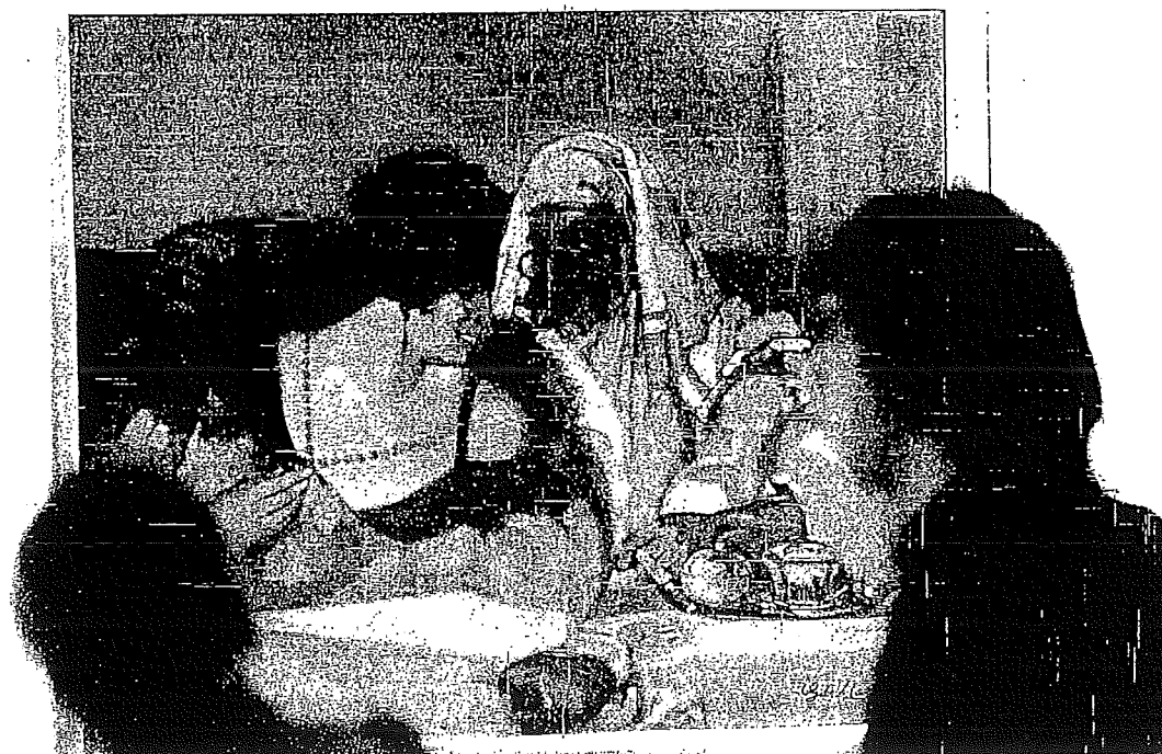
Dos personas observan la obra 'Parisina y árabe' (1922-1923).