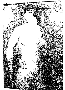
La Eva también se cederá.