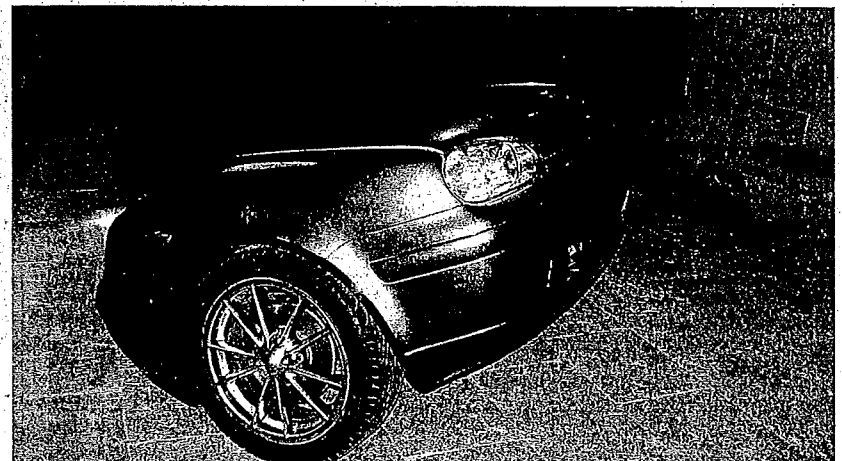
Una de las creaciones de Carlos Irijalba, en el vestíbulo del Museo Gustavo de Maeztu.