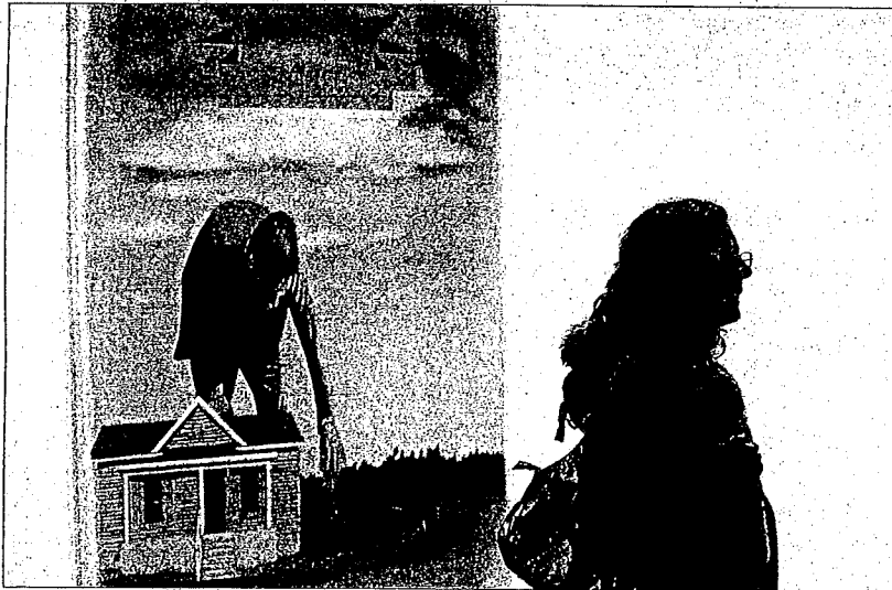
Una mujer pasa junto a una de las obras seleccionadas de la séptima edición de la bienal de pintura.