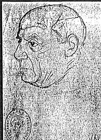
Pablo Ruiz Picasso.

Si la diversidad de los personajes llama la atención de todo aquel que contempla esta muestra, la variedad estilística