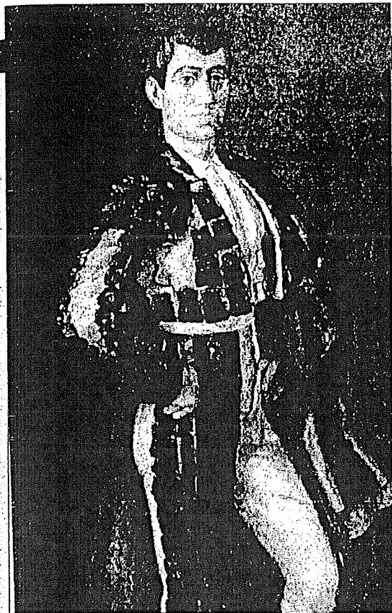
TOREROS El Espartero.

Este pintor andaluz es una de los más representativos artistas de la primera mitad del siglo XX. Varios factores son los que llevan a los expertos a calificarlo como tal. En primer lugar, su propia obra pictórica, personal e inconfundible, que le hizo convertirse en el abanderado del esfuerzo renovador de la pintura estatal anterior al inicio de la Guerra Civil. Su faceta pedagógica ha sido otros de los factores destacados por los analistas. Esto le permitió transmitir a sucesivas generaciones su modernidad, adquirida durante su estancia en París a principios de siglo. En tercer lugar destaca su creciente fama como retratista, como iconógrafo de toda una época.