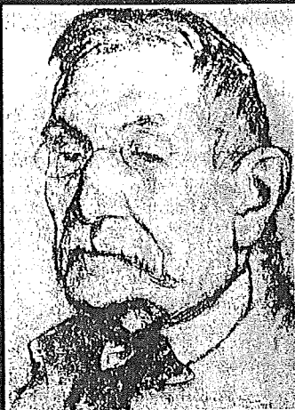
Benito Pérez Galdós.