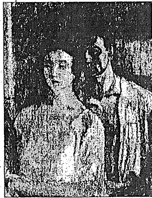
Auto-retrato con Eva en París.

que utiliza el autor no va a la zaga. Algunos de los retratados aparecen dibujados con una aproximación naturalista más cercana al dibujo académico. Otros presentan efigies elaboradas de acuerdo con la herencia cubista que adquirió al lado de Pablo Picasso y Juan Gris, poniendo de manifiesto tanto la versatilidad de Vázquez Díaz como la complejidad de significados y configuraciones que en su obra adquiere la modernidad.