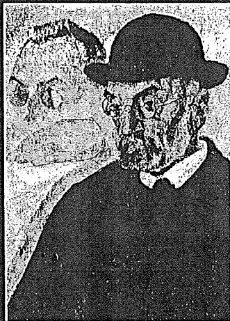
Miguel de Unamuno.