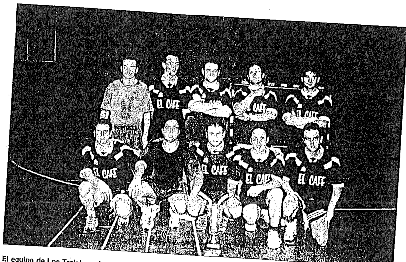
El equipo de Los Treinta se impuso en la final del campeonato de fútbol sala de Mendavia a su rival, Hamele-Pop.