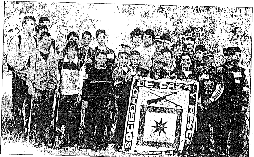
Los participantes en el campeonato para menores de 18 años posan en el coto de Arínzano, junto al Ega.