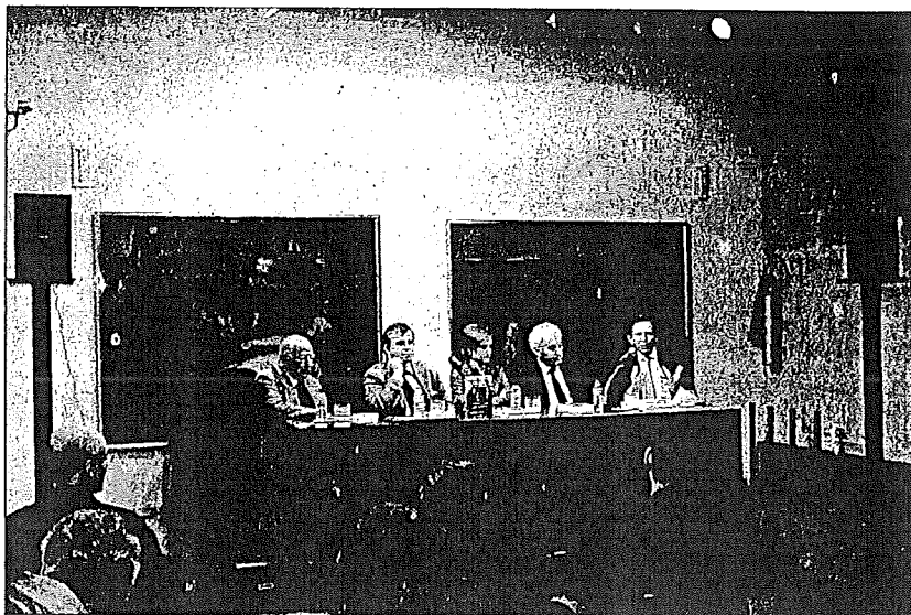
ESCENARIO El museo Gustavo de Maeztu fue el lugar elegido para dar a conocer el fallo del concurso.