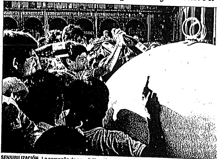
SENSIBILIZACIÓN La campaña de sensibilización afectará a los escolares.

Los primeros pasos de esta mancomunidad se dieron en 1985, con la ampliación del servicio de recogida domiciliar de Tafalla a los municipios valdorbeses de Garinoain y Barasoain. El año siguiente comenzó la adecuación del actual vertedero controlado de Romeriles, inaugurado un año después, mientras se clausuraba el anterior vertedero del Monte Plano. En 1987 se implantó la recogida selectiva de vidrio en Tafalla y en 1989 se contrató al equipo Zahori, que se encargó del diseño de esta campaña para la implantación de la recogida