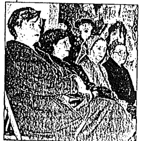
Algunos de los ponentes.