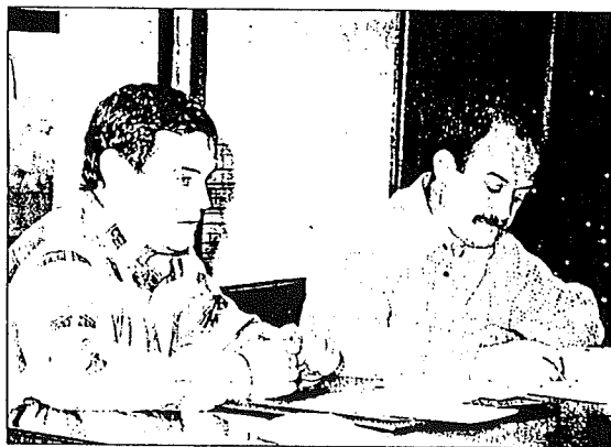
AUSENTES Los dos concejales de HB no quisieron asistir al debate. TREBOX

Para la junta local de EA debe existir en el Ayuntamiento "una persona responsable, que conozca perfectamente los vencimientos de todos los contratos eventuales", con el fin de evitar que pudieran adquirir la condición de fijos por esa vía. Apunta que, si el responsable de personal no lo ha comunicado a la Corporación, "puede ser debido a un olvido, pero si, por el contrario, se trata de una justificación política, es nuestra obligación censurarla". En la nota se dice que "entre las gentes de esta ciudad van a pensar que para entrar a trabajar fijo en la plantilla del Ayunta-