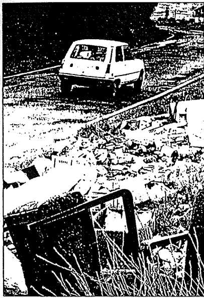
BASUREROS Uno de los vertederos que desaparecen.

ALBERTO ARAIZ Estella La Mancomunidad de Montejurra acometerá próximamente las obras de clausura y restauración ambiental de los 132 vertederos incontrolados que existen en la Merindad de Estella, lo que supondrá una inversión de 135 millones de pesetas. El Gobierno de Navarra subvencionará el 90% y el resto correrá por cuenta de los abonados.