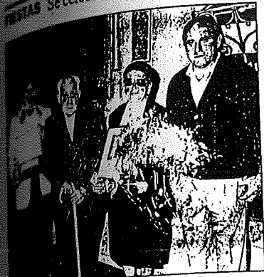
COMUNICACION En el centro de la fotografía, el matrimonio homenajeado.