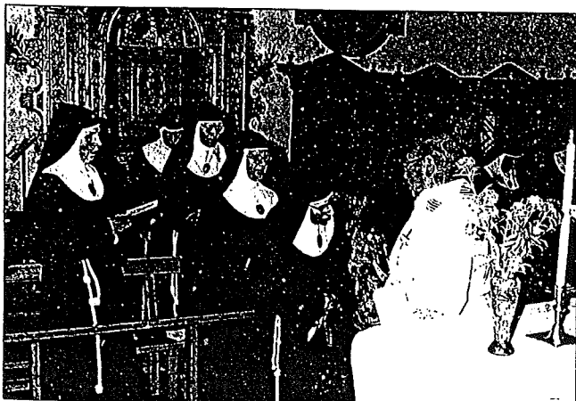
RECIBIMIENTO La primera parada del ángel fue el convento de las Clarisas.

CULTO RELIGIOSO Una multitud de ciudadanos recibió a la tradicional imagen, que data del siglo IX