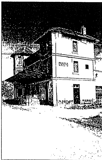
FACHADA Antigua estación de Murieta.

seguir haciendo viviendas. El Ayuntamiento carece de terrenos y los particulares -indicó- no quieren vender". Tras la aprobación del cambio en las Normas Subsidiarias, que puede tardar un año, el Consistorio se planteará qué hacer con esta nueva propiedad. "El edificio de la estación, si estuviese más céntrico, se podría aprovechar para el propio Ayuntamiento, aunque habría que reformarlo", apuntó el alcalde. Desde que desapareció el tren que pasaba por Murieta y enlazaba Estella con Vitoria, hace ahora veintiséis años funcionó de 1927 a 1967 la estación estuvo ocupada por alguna familia.