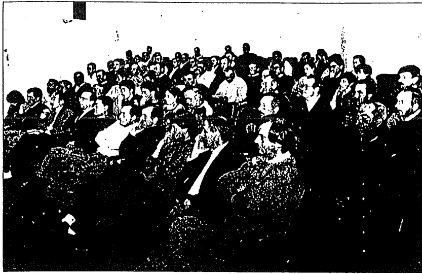
Los asistentes al último debate de la semana Agrícola.

«Cuando España entra en la Comunidad Europea, se integra y negocia unilateralmente un Gobierno que prácticamente no tiene en cuenta a las comunidades autónomas, lo mismo que cuando se produce una negociación del GATT.