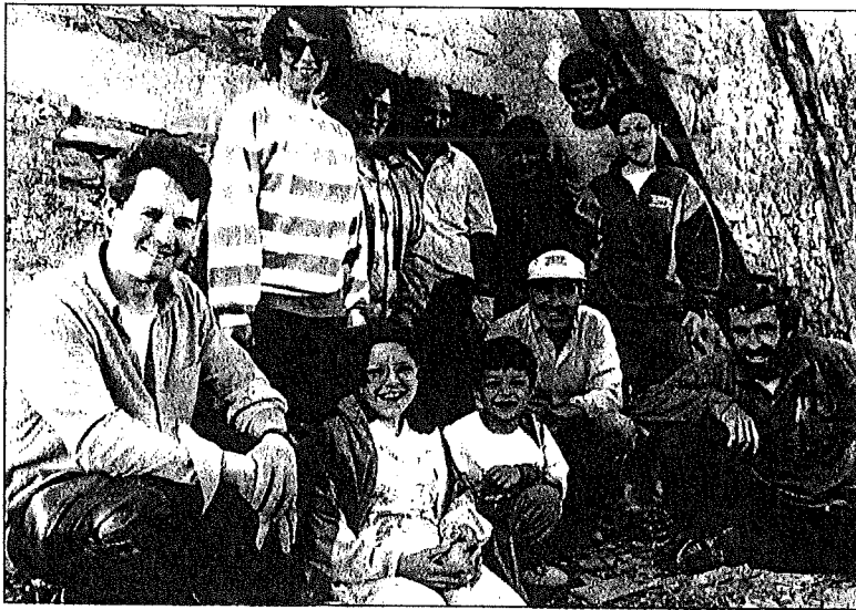
Las personas del Valle se reúnen los sábados para arreglar la ermita de San Miguel.

La andadura del centro cultural se inició con una exposición de pintura en Viloria, otra de arqueología en Galbarra, conferencias en Gastiáin, juegos infantiles en Ulibarri, un video sobre dinosaurios en Mendaza y una excursión a los centros históricos del Valle, en la que participaron 25 personas. Para el próximo sábado, ha preparado un partido de fútbol para niños de nueve años, con chavales de Estella y una conferencia sobre agricultura en una fecha sin