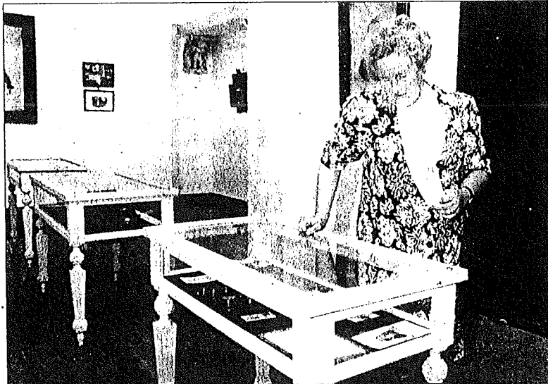
En "Fray Diego" se exponen numerosos objetos conservados desde las últimas guerras carlistas.